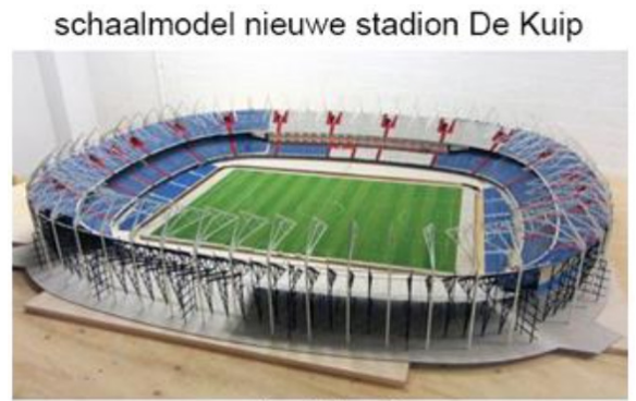
schaal 1 : 50

Hoe lang en hoe breed is de grasmat in werkelijkheid?